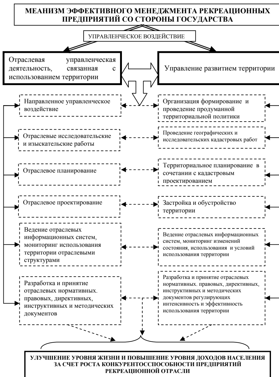
Рис. 2. Взаимодействие отраслевой управленческой деятельности как фактор повышения эффективности менеджмента предприятий

народного хозяйства. Более того земельные ресурсы являются главным средством производства не только в таких отраслях, как сельское и лесное хозяйство, но и в отраслях нематериальной сферы [12].